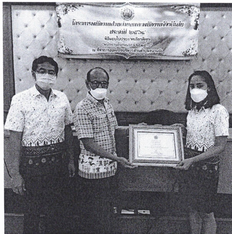
องค์การบริหารส่วนตำบลสนามชัย อำเภอเมืองสุพรรณบุรี จังหวัดสุพรรณบุรี